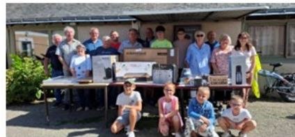
Gagnants concours au rond 2025