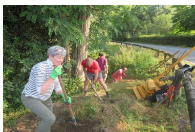
Escalier du Piron

Notre gros chantier a été la réalisation de l'escalier du Piron, près de la chapelle. Il a fallu anticiper, commander et préparer les matériaux et bloquer une journée entière de travail pour la réalisation. Le pique-nique partagé a fait de cette journée un moment fort agréable... Merci à la municipalité pour l'achat des matériaux et l'aide des employés communaux.